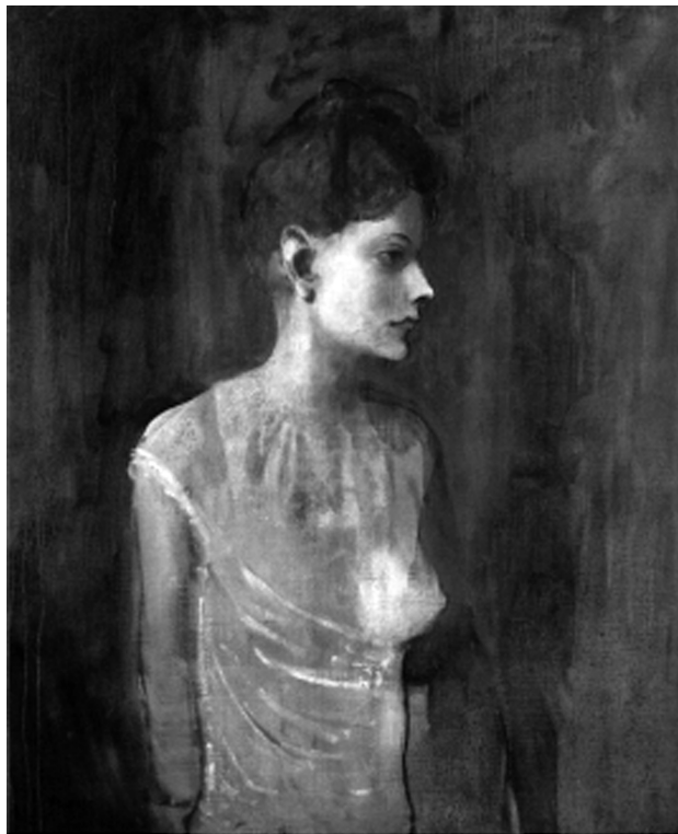
图2、《穿衬衫的费尔南多》

1904年，毕加索回到了巴黎。他搬到了一个名叫“洗衣船”的地方生活，这也是他未来5年的画室和家，同时也意味着毕加索蓝色时期的结束。在这个时期有一幅作品，体现了毕加索创作的色彩调性由蓝色向玫瑰色的一个转变。这幅作品是《妇人与乌鸦》（如图1）这是毕加索在回到巴黎后所创作的，在画面中妇人骨瘦如柴的形象在强烈的蓝色背景衬托中，形成了暗红色的剪影。蓝色逐渐被淡化了，并且蓝色时期暗沉低落的情绪正在慢慢退出了毕加索的画面，取而代之的是温暖柔和的玫瑰色调；在画面里蓝色的占比变少了，伴随着是红色的显现，画面慢慢变得温暖起来。这幅画可以算得上是过渡时期的转变。同时蓝色时期的过去也说明，毕加索从朋友自杀的悲伤情绪中走了出来。